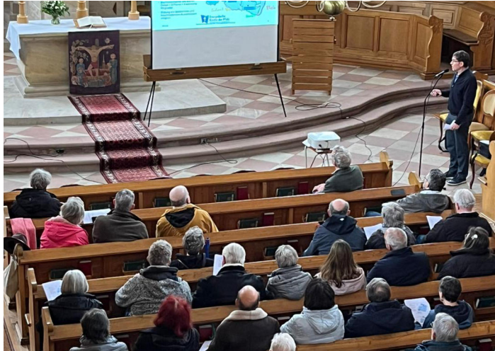
Gemeindeversammlung in der Martinskirche.

Unser Presbyterium befürchtet, dass die Rechte und Funktionsfähigkeit von Kirchengemeinden massiv beschnitten