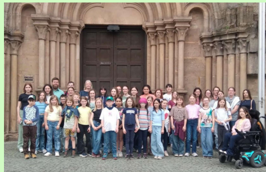
Probenfreizeit des Kinder- und Jugendchores vom 17.-19. April in Otterberg

Eingerahmt von einem Eröffnungsabend (mit den ersten beiden Episoden) und einem Abschlussfest haben wir uns sechsmal in vier Gesprächsgruppen getroffen, um jeweils gemeinsam eine Episode anzusehen und uns dann über das Gesehene auszutauschen. Die authentische und lebensnahe Darstellung der Begegnung der unterschiedlichsten Menschen mit Jesus zeigte manche überraschende Aspekte, bot viel Stoff für die Gespräche und vermittelte neue Einsichten in das von den Evangelien Berichtete.