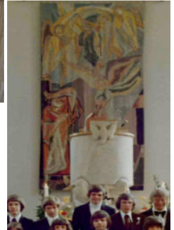
Wandteppich bei der Konfirmation im Jahre 1974.

pel (Jesaja 6). Eine Szene, die die Gegenwart Gottes in seinem Haus sinnfällig macht, was der Künstlerin als Aussage wichtig war. „Heilig, heilig, heilig ist der HERR Zebaoth, die Lande sind voll seiner Ehre!“, singen die Engel im Tempel – wie wir beim Abendmahl. Die Gegenwart Gottes kann freilich auch erschrecken,