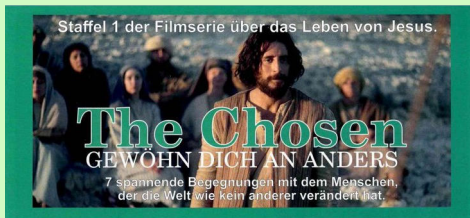
Informationen über die Serie „The Chosen“ finden sich auf der Internetseite: www.the-chosen.net .

Glaubenskurs 2026 – „The Chosen“: Zum siebten Mal haben die Katholische Pfarrgemeinde, die Protestantische Kirchengemeinde und die Stadtmission Grünstadt gemeinsam einen Glaubenskurs angeboten. Diesmal war das Thema „The Chosen“.